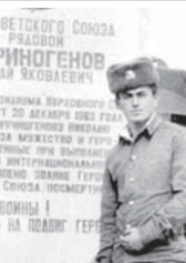
FOR SOVIETSKOGO СОЮЗА РАБОТАЮЩИЙ АНЧИНГОЕНОВ ИКХАЛАН ХУВАЕВ

кавказлыны намыс тоюргени иш этмегенде. Ма Тимурча, Габаска, Зарифча жетгерлибени юслеринден жазарга тийишлиби», деп ышарады ушак негерибиз. Сейр да болур, алай адамны майысы алай кыралыды – кыйын болулагы койренке болуп кылады. «Аны айткан да кылай этеим, алай атышканды, негерлерин атышканды койрени кыласа. Жунумай, кыууун этеи, кесинги ты билли, сакълык къазуаттан сау кыйтырга болушан да болур», дейди ол. Ол сынаулауда уа кенделенин жашка