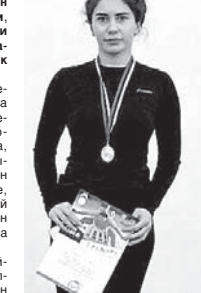
Заман бла төргенде, хау, сумо тынчырак да болур, алай ол кысыга заманын ичинде хорлап чыгыр ючюн, спортчудан кылай шартла изленедиле?