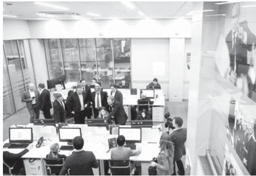
беллик этеригин чертгенди. - Февралы ахырында бу Ардада болганында, Россияны Президентини Владимир Владимирович Путин биллай махемелени къыралыбыны регионларында да къуарарга кереклисин айтханды. Россияны Правительствоосу эмда РФ-ни Президентини СКОФ -да толу эркиликке келечиси Юрий Чайканы болушлуклары бла Къабарты-