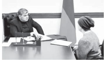
Регуону онуючусу келгенде болганы тынгылаула тийишли буйрукла бергенди, аланы топуруучу власть органа-

Къабарты-Малкъарны Башчысы Казбек Коков КъМР-ни Правительствоосуно ююнде республикада жашаган къауум адам бла тюбешгенди эмда аланы тилеклерине бла таргыгуларина тынгылаганды. Ала уа асламысында жашу журтланы къылгыты, къыйын саусузга багыу, кеп сабийи эм кылоясыз юйорлеге, къылуулаула болушлук этерге кереклиси бла байламлы эдиле.