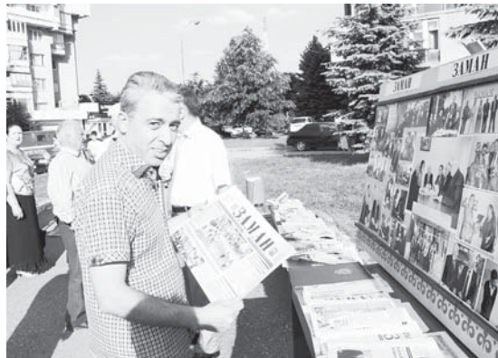
Алим «Заман» бла.

устадыла, музыкалы инструментлени да согдадыла.