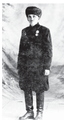
Тутулганынны бирге жыйып, Полшага келтиргенде. Андан аланы Германияга ёдюрлөп, бирер жерде энчи адамланы кыолларына берип ишлетирге эди фрашистени улмулары.

Улуу Ата журт уруш башлан-ганды, аны кызауатха чакыр-гандыла. Ал жылдада сер-мешле кыты баргандыла. Ол, кытуула келип, Воронеж тири-синде жесирликте тошганды.