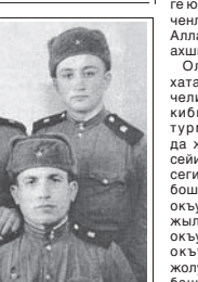
Той-оюн бла ашыргъандыла аскерге