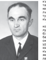
1959 кылырча заман болганды. Аллында аны Кескелен району Улуу Алма-Ата эл советине депу-тату айыргандыла. Би-

Маштайны мамыр ишин Улуу Ата журт уруу тохтаганды. Ол, беш сабийни атасы, фронтка чакырылып, анда тас болганды. Жалдан бир кыгъыт келгенди андан. Хаматерий оюорде тамата эди да, атасындан хатар юзюлгенле, барыны да адуурлугун кесине алганды. Кейнчокюлде ала Кыгъыгъастанда Кызагъа тууганды. Анда Кимини эсе да тил этпени ала беш сабийни аяны Кеккёзю тутуп, апы жылга суд эткенди.