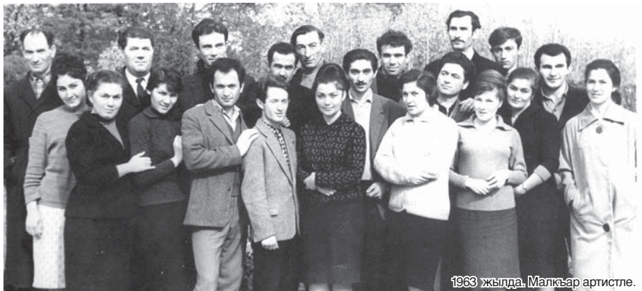
1963 жылда. Малкъар артистле.

Дагыда актриса Александр Островскини «Хайырлы жер» пьесасында баш иесин алдаған бийче тиширү Анна Пав-