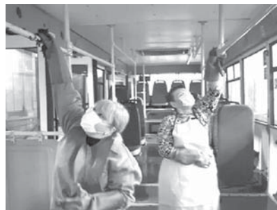
ала «Таксопарк» предприятиядан арысында бирсилени да жокъларыкъдыла.

Сагъынылгъан жорукъла толтурулурларына, шахарны администрациясыны келечилери контроль бардырадыла. Кёп болмай