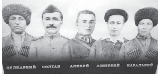
Зулкварний Биймырзаны тамата жашы Зулкварний элде, колхозда да иште да тири кытышканды...