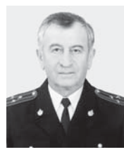
ВВ-ны ветеранларыны Нальчик шахар совети.