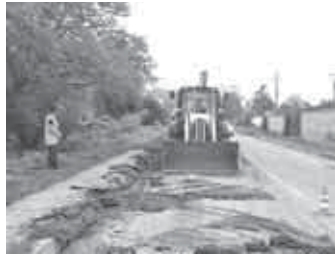
Саулай айтханда, ишлени быйыл 30 октябрьге дери бошаргъа умутлудула.

Анда асфальт алышындырыллыкды, автобус тохтаган жерле, жаяу жолчукла салынырыкдыла, жол жанларын тапландырыкдыла эм Т-7 светофорла да орнатыллыкдыла.