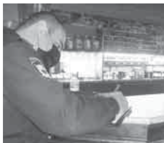
къуллукчулагъа уа аны ёлчечи 10-50 минг сомгъа жетеди.

РФ-ни КоАП-ыны 20.6.1-чи статьясына тийишлиликде регионда къоркъуулу болумгъа хазырлыккыны низамы кийирилген кезиуде бузукълукъ этген инсаннга аны юсюнден эсгертирирге неда 1-30 минг сом тазир салыныргъа боллукъду. Жууаплы