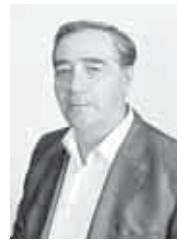
рилип, кыралла болукк тойюлдоиле. Хау, ол заманда бу чакырык кели аллына унутулуп кыал-дыкты. Алай ол кезиле да Россияни халклары бир бирлерине сыртларын бурлук тойюлдоиле.

- Кавказ урушун юсюн-ден айтханда, бирле аны зорлаган кырал-га кыажууларын бил-диргени ансы. Сиз а «Емюрле Россия кыла» деген чакырыуга кылай кырайсыз? - Философла айтхаллар-дыла, бир кезиле дуния башында биз китеу чекле кете-