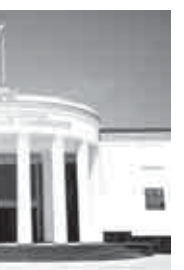
5-чи жерге чыгарганды. Студентлени алгышый-биз, мындан арысында да алга улуу жетишимле, аруу хорламла тежейбиз.

управлениясын игиленди-рирча кыралган эсгерте-рирча» деген проекттерин көргюзтү, олимпиаданы экинчи урумунда 4-чо жер-ге тийишл болгандыла эмда кызыланы битеулюу