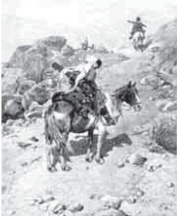
Черкесли атыла таулада. Суратны Вируц-Ковалевский Алфред ишленди. 1885 ж.

ланы кырамазга оноу чыгарылганды. Болсада газетибини бет-леринде Кавказ урушун тарыхын сагышырга тийишли көргөнбиз. Аны азбын бютюднда адыг халкыла сынагандыла. Тюрло-торло шартлагы керө, 18 ёмюрде аланы саны миллионга жете-ди, кызауат болшолган-дан сора 33 жылдан (1897 жылда) Россияни халкы-ны санын кыздырганда ачыкылган тарихлеге керө, ала 165 мин бол-гандыла. Миллетни асы-ны кызауатта кырал-ганды, кыалгында уа орус аскерден кычып, Осман Империяга көч-гендиле.