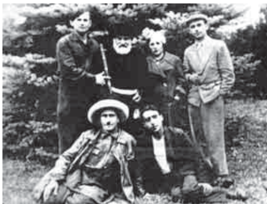
Мечиланы Кязим жазуучулары къаууму бла.

Искусствобузну, маданиятыбызны да бийикге кётюрген, аны айныууна кыйын салгъанлары ючюн Россейни сыйлы атларына тийишли болгъан адамларыбыз бла дайым ёхтемленебиз. Ала жазуу иште, миллет тепсеуледе, жыр искусствода, театрда да кеслерини шарт ызлары, унутулмазлык жоллары кыйгъандыла, жамуатны хурметин бла сыймеклигин тапхандыла. Бу бетде аланы къауумун дагыда бир кере сагыныргъа излейбиз.