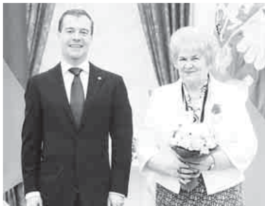
Зумакулланы Танзила Кремльде саугаланган кезиуде.

Искусствобузну, маданиятыбызны да бийикге кётюрген, аны айныууна кыйын салгъанлары ючюн Россейни сыйлы атларына тийишли болгъан адамларыбыз бла дайым ёхтемленебиз. Ала жазуу иште, миллет тепсеуледе, жыр искусствода, театрда да кеслерини шарт ызлары, унутулмазлык жоллары кыйгъандыла, жамуатны хурметин бла сыймеклигин тапхандыла. Бу бетде аланы къауумун дагыда бир кере сагыныргъа излейбиз.