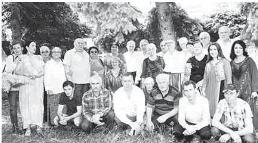
Малкъар театры шёндюго труппасы журналистле бла тюбешген кезиуде.