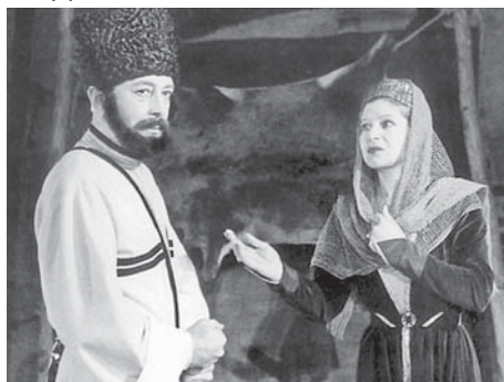
«Гошях бийче» спектакльден.

генди. Аны бир уллу суймеклиги болганды сабий жылларындан окуна – китап октургга бек суйгенди. Аллай онг чыкыганды, несин да унутханды. Школну Кызахстанда Павлодар областыны Успенка элинде бошаганды. Тамам ол жылда кыйтханды атала жерине да.