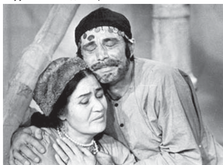
«Ай тутулган кече» оюндан.