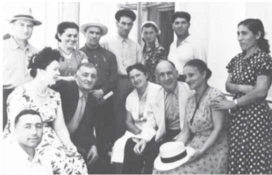
Театрда коллегалары бла.