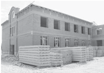
«Шендюгю школа» деген Федерал проектни чеклеринде Солдатская станицада орта би-

Жангы школга бир кезиуге 250 окыуучу жюрюрюкдю. Объект битеу шендюгю стандартлага эм излемлеге кере ишлене турады. Анда хар кереклиси да болуккду. Кабинетлери тийишли оборудование бла жалчытынырыкдыла. Министерствода айтханларына кере, школ быйылны ахырына битерикди.