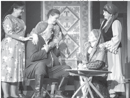
«Жашау – ёрлеуду» спектакль.