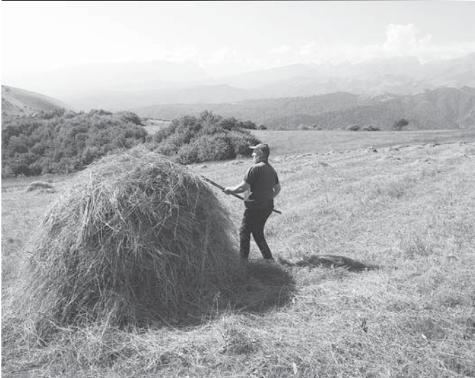
Бичен жыйуу кыстау барады.