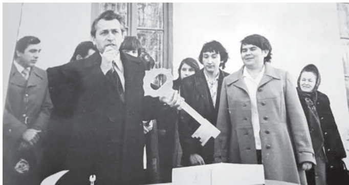
Жангы фатарладан ачычла берген кезиу.

Алим а Москвада налог полицияны академиясын