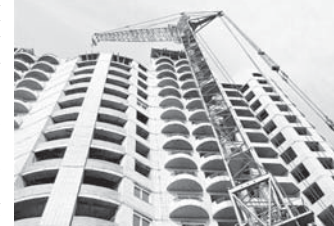
11,6 процентке асламды. Ол санда эл жерде 83,3 миңг квадрат метрге

жуюук 712 фатар соеулилингенди, мында да 46,6 процент өсөм эсленеди.