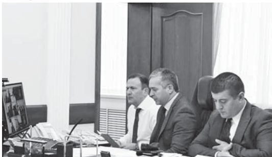
Федерал бюджетинден 1,443 миллиард сом берилгенди, республиканы бюджетинден а - 102,5 миллион сом.

Инсанланы талай къауумун жашуу журтла бла жалчытыр ючюн, кыралыны жанындан болушулук бериледи. Ол санда 841 адамны ипотека кредитерини кир кесегин жабарга 12,9 миллион сом субсидия халда бөлөнгөндө. Аскер къауыгалаг кыатышан эмда алада суаулькларын тас эткен тогуз ветеран, сора дагында 55 жаш юйор фратар сатып аларга социал төлеуе къошулу болганды. Быйтыр бюджетине къошулган объекти барыны да къурулушарына этилген къорандаланы өлчөми 1,546 миллиард сомга жеткенди. Ол санда кыралыны