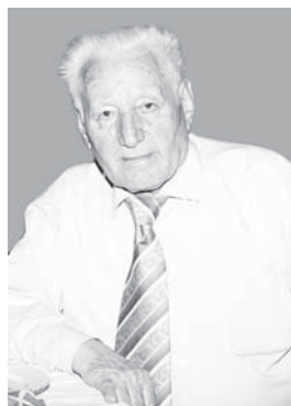
кыуум тепсеу салганды.