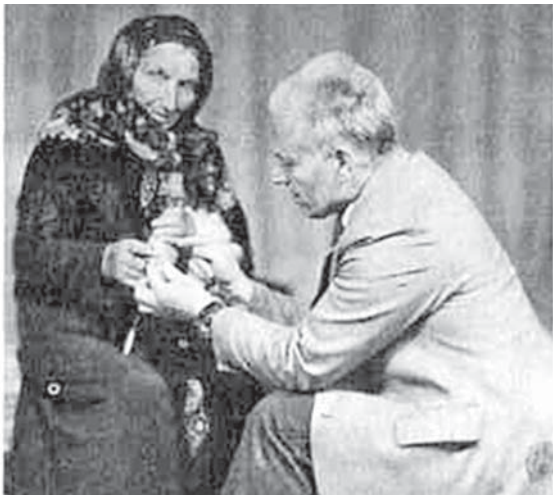
Далхат анасы бла.

Быланы хар биринде да, жырда, таурухда, оюнда болса да, кыарай-малквар халккы таратыбызны эсгереди автор, ненча