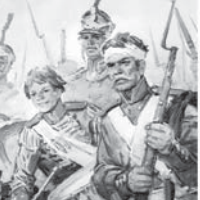
Бордино сьермешни жьиттерини. Суратчы В. Шевченко. 1970 ж.

Сьермешин харьм бля бошарьга орусунлагьа сьодатланы бля офицерлени чексиз жьитилектери, ол конлөдө Шьеввердин релуьта, Багратиону Фьлешеринде, Раевскийни батареялери, Уткинени дуньрунда, Семьонько ани тьйресине, Колочи черекни жьагьаларында демлешелде кьыларын, жалларын аямь корюшегенине болушкьанды. «Биз кюн россияни