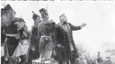
М.И. Кутузов Бординода. Суратчы С. Герасимов. 1952 ж.

1912 жылда 24 (юноьда) Нопьлеону «Деменил аскери» Неван черекден ётпоуно башлагьанды. Россияни чекти-кьыйлары болмагьан жерине биринчи устанкьылыкь этгенине хатасындан башланган эди орус халкьы душманьга кьызуу Ата журт урушу. Бизни кьыралыбыны тарькы бек байды жьиттик шартла бля. Алай эсе да, Бординода сьорь-