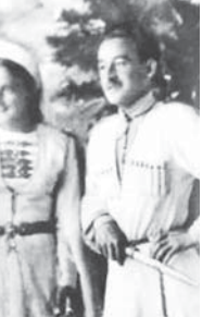
Солдон оңго: Сотталаны Адигерий, Кочмьзаланы Шариф, Боташланы Исса. Улуу Ата журт урушун аялгьан.