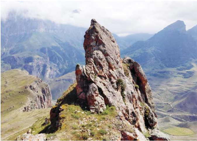
Холамы тик кыялары - ёмюрлени шагъатлары.