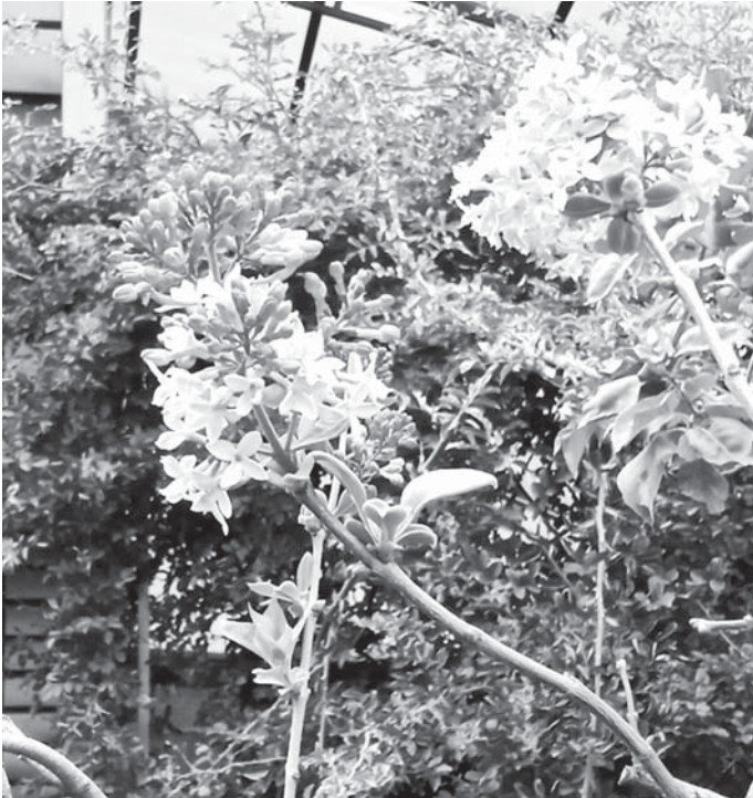
Кюз артында яс юлкю (сирень) чакъганы сейриндиндегенди.