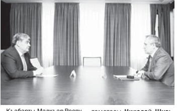
Къабарты-Малкъар Республиканы Башчысы Казбек Кокков Москвада «РусГидро» ПАО-ну генералны директору – правленийи таматасы Николай Шульгин оуула бла тюбешгенди. Жолугууну алында Казбек Валерьевич «РусГидро» оюнуучуларына коронави-

Бугагъа Беларусь халкъла аралы майданда Къабарты-Малкъарны баш парламенттерини башламчылары бла регионла аралы байламлыкъланы соруула да кѣтюрюлгенди.