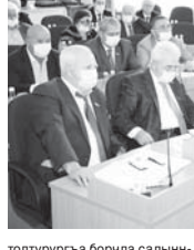
Толтуруугъа борчла салынгъандыла