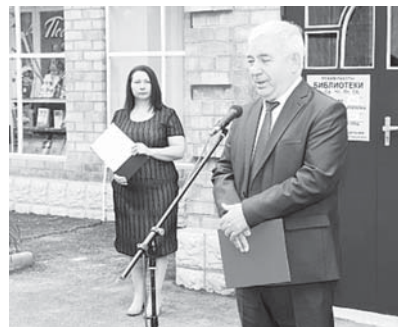
Майскийде орнатырга оңоу не ючюн этилгени да айтхандыла. 1829 жылда майда Пушкин Кавказга келеди. Көргөни, эшитени ол дненикге жазып турганды. Анда Горжю табарбарын кезикчүне Екатерина граддан чыгып, аскер постланы да озуп, Владикавказга жетгени билдире эди.