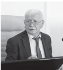
1 декабрьге дер хазырларга керекди. Жыйылыуа къатышхана башха соруулары да сюзгендиле. КъМР-ни Парламентини пресс-службасы.

бла байламды. Бу иш РФ-ни «Власть органлары ишлерин къурауу эм тамамлауу нызамын игилендируу бир-бир соруулары юсюнден» 1-ФКЗ номерли федерал законуну 1-чи статьясына тиийлиликте этилди.