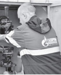
«Газпром газораспределение Нальчик» компания кѐк отлук бла жалчыгын инфраструктуруны кыши кезиуде чурумсуз ишлерча этгенди, деп билдиргендиле аны пресс-службасындан.