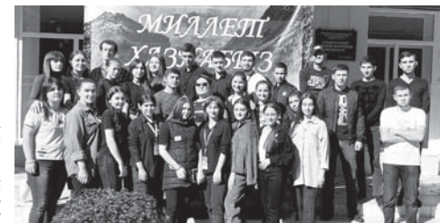
Миллет хазна форумуна катышканы.

Форумну иши миллет адет-төрөлерибизни, кырал-малкяр халкк чыгармачылыккыбызны, тарыхкыбызны, адабият, маданият байлыккыбызны, белгилли адамларыбызны, башка жетишмилерини юсондерин жаш адамланы билгилерин юн, эришүү халда көтөрюуге аталганды. Бу