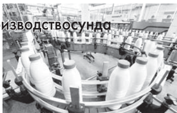
Алайда 270,6 миң мал барды, аладан 132,2 ийнекдиде. Кыойла бла эчкиле да 390 миңден аспамдыла,

асламды. Малланы бла юк кыанатыланы этинден 75,4 миң тонна, алгын кезиуден 3,1 процентке көбюрөк, сатылганды. Жумуртхаладан да 159 миллион жыйылып, 2,5 процентке өсюм болдурганды. Болсада малланы санына иги кесек кыошулган деп айтканы тойдюлдү. Биринчи октябры эсепленине көрө, молкледде сау-