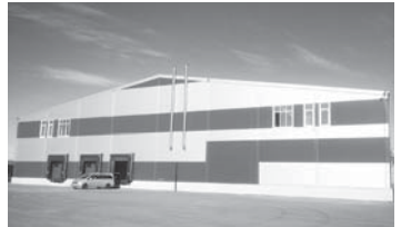
корпусун бошاپ, ичинде энци оборудование сала туралды. Жаны комплексини хайырында тирликки керге кел жыргъа онг табылыкды (5 мингден 12 мингге дер). Аграрчиланы да кеслерини 100 гектарда терк айныгъан төрек бахчалары барды.

Шимал Кавказы айныту корпорация (КРСК) Къабарты-Малкъарда эм улуу жемишле сакълагъан база ишлерча «Агрохолд» компаниягъа аха бөлгенди. Алай бла жуукъ заманда Баханды 7 минг тонна тирлик сыйындырган комплекс къураллыкды. Аны осюнден КъМР-ни Эл мюлк министрствосуну пресс-службасындан билдиргенди.