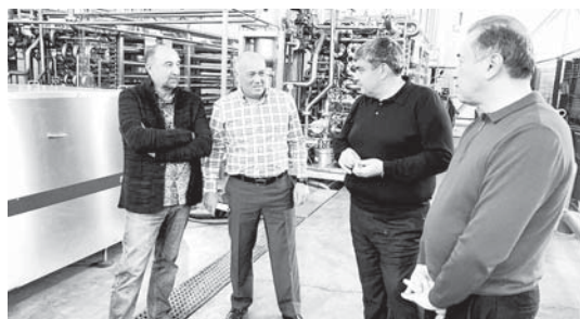
Проектни маганалылыгы аны импортну алышыдыруунаады. Завод ата журту рынокда сурам болган качеству продукция чыгарыады. Аны конкурентликке чыдалыуа а экология жаны бла таала журту рынокда сурам болган качеству продукция чыгарыады. Аны конкурентликке чыдалыуа а экология жаны бла таала журту рынокда сурам болган качеству продукция чыгарыады.

сальинганды, аны хайырындан жылга 100 миллиондан артыкъ улусный банка чыгарыууча онг барды. Алай бла 2020 жылны 9 айына 80 миллион банка чыгарыууча алмаланы жарашдыруу бла кюрешеди. 2021 жылдан бери организацияны аллында инвестиция проектини экинчи уруму жашауда бардыруу борч салынганды. Аны хайырындан заводну кючю жылга 24 минг тоннага берн өскюриди. Экинчи делим кыйрылса, 70-ден артык ишчи жер къураллыкды.