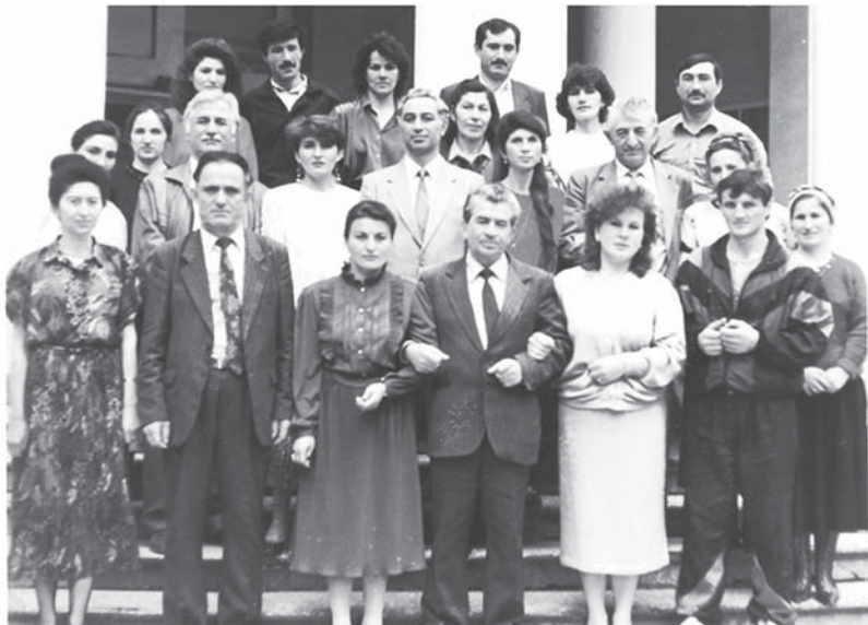
Гузеланы Жамал коллегалары эмда устазла бла.

Устазык этген жылларын санамай, илму бла кюрешген кезиуон айтсак, 50 жыл чаклы ол тилибизни айныты-