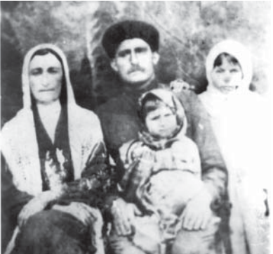
Бу сураттагы адамла шыкчыладыла, дейди. Ким болганларын айталык чыксо, тарыхбызны дагыда бир аруу бети ачылыкты.