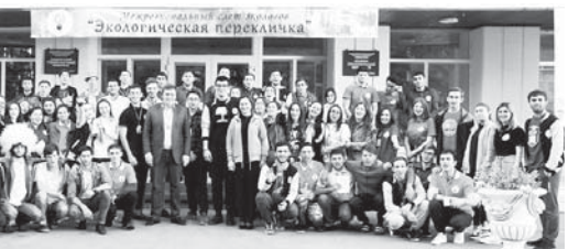
ны келечилерини «Волонтерланы экологаны жыл сайын бардырылган «Экологическая перекличка» регионал аразыны слетлары, «Жашил дорен урунуу экология отряд» эселе ишлерди. Бегилгеиоизму, бу конюле уа аны презентацияны

болган ведомствону кырал жаш телю департаментини башламчылыгы бла вуздада юйретууну маганысы едюрюу муратда кыралгынды. Ызы бла проектлен Zoom платформада кырууларганды. Эсепте чыгырылгындан сора уа КыМК-ну проекти - Студентлеге клуб системаны башча-башча ыздада айнтыу» номинацияда эм ахшы онсуну арасында болгынны билдиргенди. Ол а университетини жаш телю политика элдю юйретуу иш жаны бла управленгысы