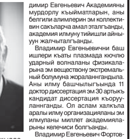
Владимир Евгеньевич Фортон

Ата журтуу эм дуняа илмууга уллу бушугу сыйнагы тошениди. 29 жылда 29-июльда белгилэ кыарал эм илмуу куулукчу, физика-математика илмууны доктору, профессор, Илмууны россей академиясына академиги, РАН-ны Бийик технология жаны бла бирлешкен институу илмуу таматасы, КМР-ни илмууну сыйлы куулукчусу, Х.М. Бербеков аты Къабарты-Малькы кыарал университетни сыйлы профессору эм попечители советини келеничи Фортон Владимир Евгеньевич дуниядан кеттиди.