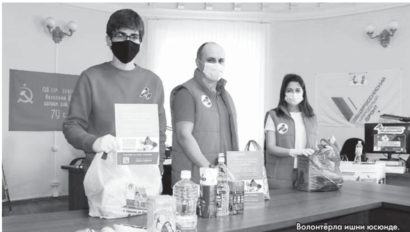
Волонтерла ишни юсюнде.

Бююнлюкте аланы саны жюз мингден атлагъанды. Газетибизни бу бетинде биз да аллай адамланы бир къаумун кергозторге сюебиз. Кимледиле ала, кимге окъуйдула, къайда урунадыла, бу огурлу ишге не хыйсап бла къатышадыла.