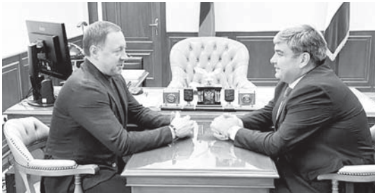
орунбасары – ДФО-да РФ-ни Президентини толу эркинликке келечиси Юрий Трутнев Шимал-Кавказ федерал округга ишчи жолоучулукъ бла келгенде берген буйрукъларына жашауда бардырылыуларына бургъандыла. КъМР-ни Башчысыны бла Правительствоосуно пресс-службасы.