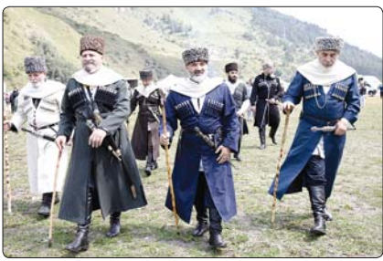
«Урсейм рекордэр зрагта х тхьл» проектын ипк иткэ фестивал кызаргэзэщэ ики иргээнүйжэ. КЭБ-м и Правительствэм, «Кавказ Ишээрэм и курортгар» акционер зэгүхэньгэм, «Урсейм лэщ» кэралло спорт зэщэжэееньгэм.