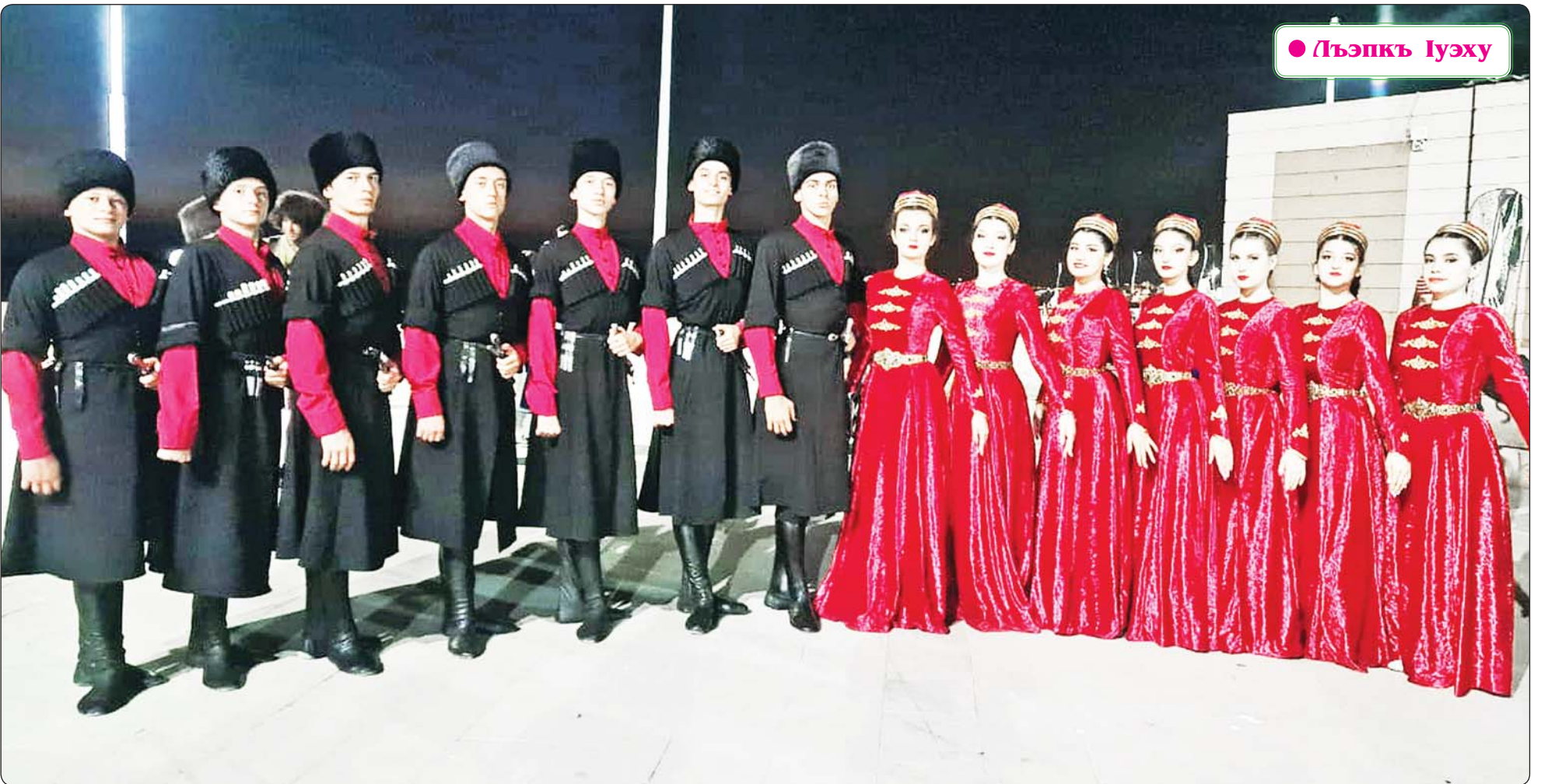
● Лъэпкъ Іуэху