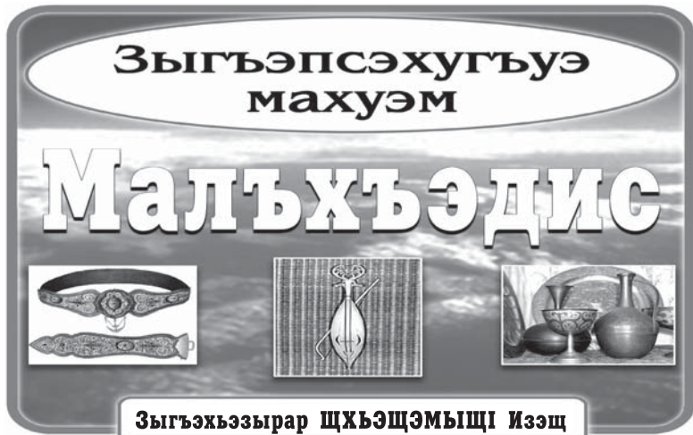
Зыгъэхъзырар щхъэщэмьщлэ Изэщ