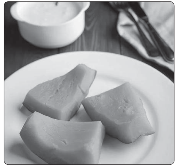
Гупщцэурэ гъэжъа къэб

Халъхъэхэр (цыхуитл ыхъэ): джэшу - г 200, псыуэ - г 1450-рэ, бжыын укъэбзауэ - г 30, тхъууэ - г 60, шатэу - г 160-рэ, шыгъуу, шыбжийуэ, джэдгыну - узыхуейм хуэдиз.