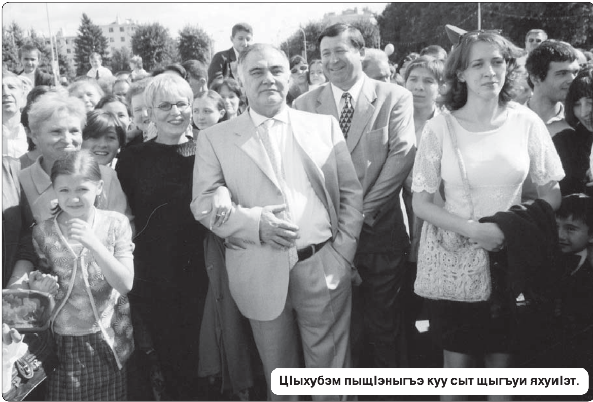
Цыхубэм пыщлэныгъэ куу сыт шыгъуи яхуилэт.

Цыхур кышыпхэмыты-жым дежщ абы и уасэр нэсу кышыпщлэр. Зэман нэхьыбэ дэкихуклэ, нэхь иупщл мэхьу Клуэклиэ Валерэ ди республикэм, Урысей Федерациэм зэрыщыту я зыужьыныгъэм хуищла хэлъхэныгъэ иныр. Сэ гъащлэм фыщлэ хузощл а цыху гъуээздэм и гъусэу ильэс 20-м щигъуклэ сылэжьэну Іэмал кызырэзитам щхьэклэ.