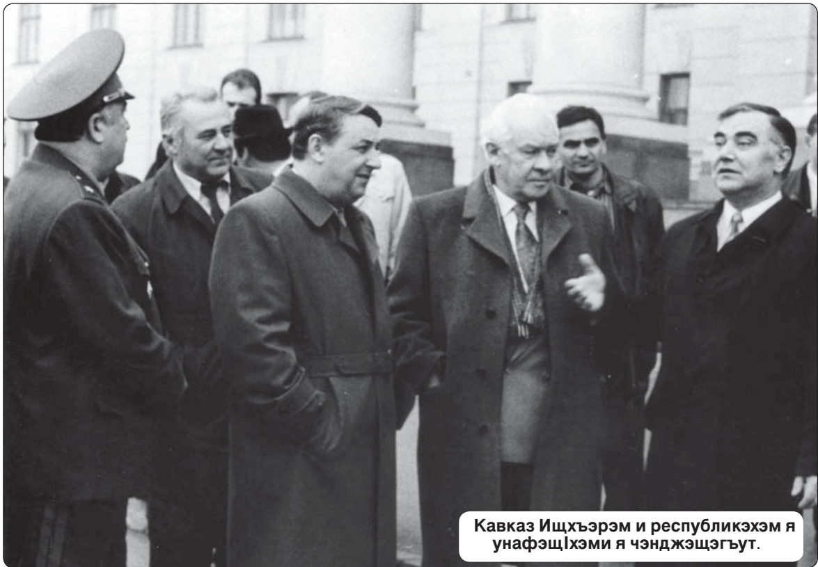
Кавказ Ищхьэрэм и республикэхэм я унафэщлэхэм я чэнджэщэгъут.