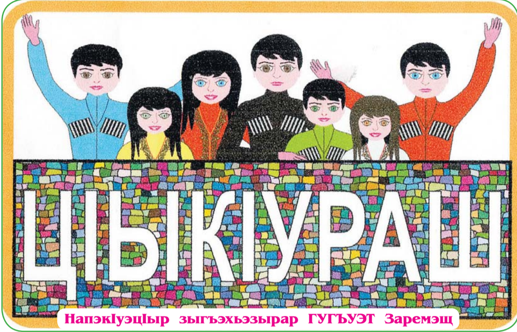
Напэкуэщыр зыгъэхъзырар ГУГЪУЭТ Заремэщ