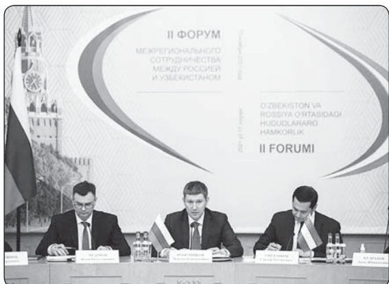
(Къэуыр. Пэщлэдзэр 1-нэ нап.)

Урысейм и Президент Путин Владимир Зэхуэсышхуэм хэтхэм захуигъазу яхуигъэха тхыгъэм итщ: «Урысейр Узбекистаным и сату-щлэгъу нэхъыщхъэ дьдэхэм ящыщ икли а къэралым хамэ хэхуэм сатууэ ядищымккэ етуанэ увьпэр тьыгъщ. Пандемием и лъэхъэнэми нэхъри зеубгъу ди къэралхэм экономикэ и лъэныкъуэккэ ялэ зэпыщлэныгъэм. 2020 гъэм сатууэ зэдэтщлар процент 16-ккэ нэхъыбэ хуащ икли доллар мелардик и уасэм нэблэгъпащ».