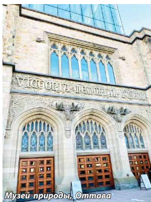
Музей природы, Оттава

(Окончание. Начало в №№ 48-50, 2020 г. и в № 4, 2021 г.).