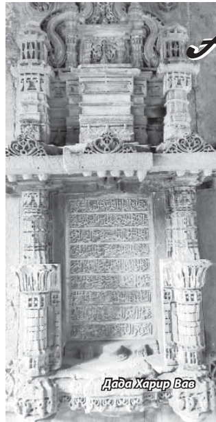
Дада Харип Вав