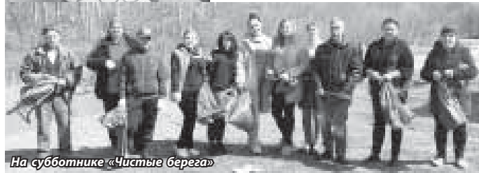
На субботнике «Чистые берега»

День местного самоуправления отмечается в России 21 апреля по Указу Президента РФ. А датой праздника установлен день издания Екатериной II в 1785 году жалованной грамоты городам, которая положила начало развитию российского законодательства о местном самоуправлении. Дальнейшее развитие местного самоуправления было связано с земской и городской реформами Александра II. После революции идея самоуправления была забыта вплоть до конца 1980-х, когда в стране началась реформа государственной власти. Конституция РФ, принятая в 1993 году, закрепила самостоятельность местного самоуправления. Его реформирование и развитие продолжатся до сих пор.