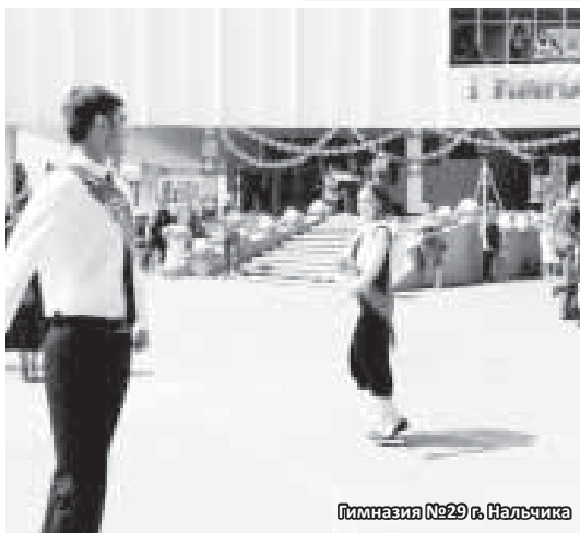
Гимназия №29 г. Нальчика