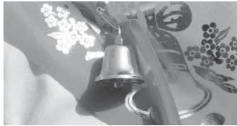
Глава КБР Казбек КОКОВ поздравил выпускников республики с окончанием школы: