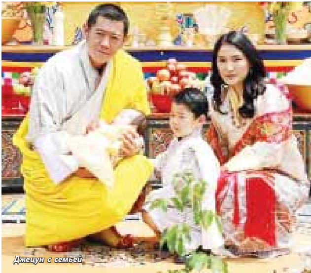
Джецун с семьей