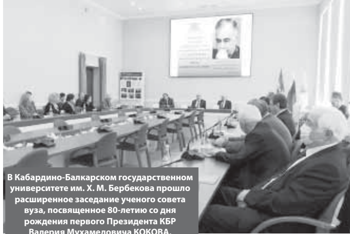
В Кабардино-Балкарском государственном университете им. Х. М. Бербекова прошло расширенное заседание ученого совета вуза, посвященное 80-летию со дня рождения первого Президента КБР Валерия Мухамедовича КОКОВА.