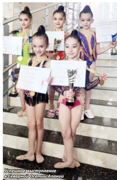
Успешное выступление в Северной Осетии-Алании

Конечно, нас всех не мог не затронуть скандал с выступлениями российских гимнасток на недавней