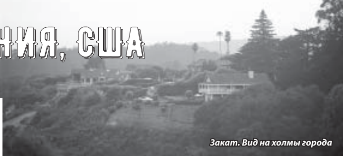
Закат. Вид на холмы города

лучшее для своей семьи и выделяя наиболее эффективные и необходимые часы для работы.