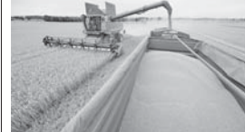
По информации Федеральной таможенной службы, по прошлому году наиболее востребованной на зарубежном рынке оказалась продукция пищевой и перерабатывающей

По итогам 2020 года Кабардино-Балкария экспортировала в страны дальнего и ближнего зарубежья продукцию агропромышленного комплекса на общую сумму 22 миллиона долларов США, что составило почти 113 процентов к плану.