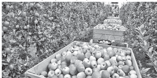
Урожай яблок-2020. Сады Баксана

Свыше 517 тысяч тонн плодово-ягодной продукции собрали аграрии Кабардино-Балкарии в 2020 году, что является рекордным результатом для региона.