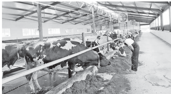
Роботоферма К(Ф)Х Купшинов. Прохладненский район

В последний день августа 2020 года Федеральная налоговая служба отменила регистрационную форму ИП-глава К(Ф)Х, изменив форму №Р21002 «заявление о государственной регистрации крестьянского (фермерского) хозяйства» на форму №Р21001 «заявление о государственной регистрации физического лица в качестве индивидуального предпринимателя»