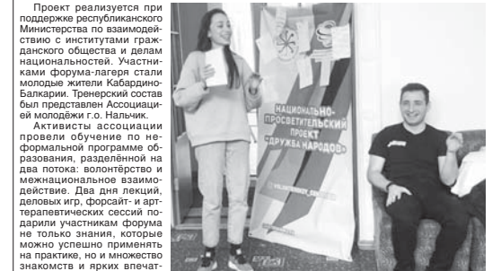
Участники форума-лагеря в Нальчике

В Нальчике прошёл всемирный форум-лагерь «Дружба народов» – республиканский этап реализации национально-просветительского проекта общественной организации «Волонтерский центр КБР».