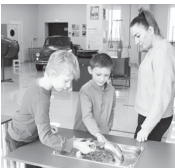
Музей занимательных наук

Конечно, нашему музею пока далеко до таких масштабов, но кое-чем и мы можем удивить и заинтересовать. Тем более что мы занимаемся не только популяризацией науки: наш единственный музей – второй в стране после московского, в котором существует экспозиция «Занимательное здоровье».