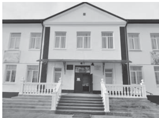
Так выглядит школа №2, которую более года возглавлял Али Шогенцуков