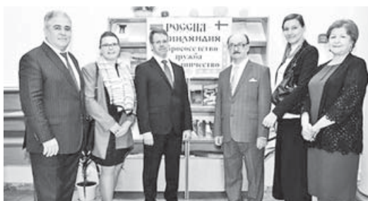
Полномочный министр посольства Финляндии в России Антти Хелантеря (третий слева) в сопровождении министра культуры КБР М.Л. Кумахова посетил государственную Национальную библиотеку КБР имени Т.К. Мальбахова, апрель 2018 г.

ством установления и развития разносторонних культурных связей нашей республики с соотечественниками за рубежом. Являясь членом Правительства КБР на постах министра внешних сношений и по делам национальностей, министра иностранных дел, министра внешних связей КБР, проводил большую работу по урегулированию межнациональных конфликтов, укреплению дружбы между народами республики, установлению и расширению разносторонних связей нашей республики с субъектами Российской Федерации и странами зарубежья. Находясь на посту постоянного представителя КБР