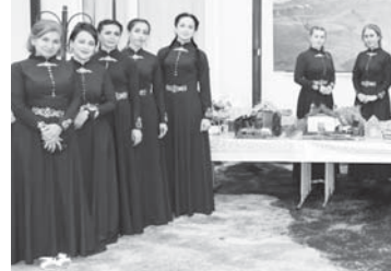
Нацпроект начальной школы-детсада

Пристальное внимание администрация школы уделяет питанию учащихся. Для контроля за организацией питания создана комиссия. С 1 сентября 2020 года школьники 1-4 классов получают бесплатное горячее питание, за учеников 5-11 классов ро-