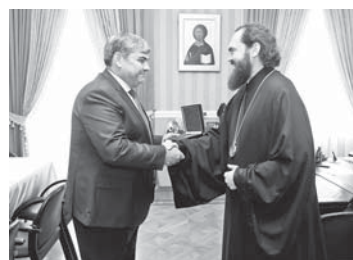
Пресс-служба Главы и Правительства КБР.

Вручая государственную награду Кабардино-Балкарской Республики, Казбек Коков отметил огромное внимание, которое руководителю Пятигорской епархии неизменно уделяет Кабардино-Балкарии. Глава республики акцентировал, что за десятилетний период служения Пятигорской епархии внесла большой вклад в укрепление межконфессионального согласия в республике, а служители Русской Православной Церкви в Кабардино-Балкарии постоянно участвуют в мероприятиях, направленных на формирование здорового образа жизни среди населения, оказывая помощь нуждающимся независимо от вероисповедания или национальной принадлежности.