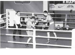
Материалы рубрики подготовил Альберт ДЫШЕКОВ.

Отметим, что все представители нашей республики, ставшие победителями, уже имели звание мастера спорта России и на этих соревнованиях подтвердили его.