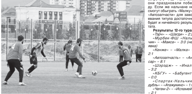
Материалы рубрики подготовил Альберт ДЫШЕКОВ.

ПЕРВЕНСТВО ПОЛ. ЗОНА «ЮГ». ПОЛОЖЕНИЕ НА 21 МАРТА