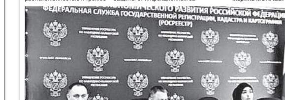
Федеральная служба государственной регистрации, кадастра и картографии (РОСРЕЕСТР)