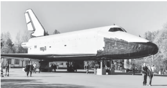
Космический комплекс «Буран» на ВДНХ в Москве